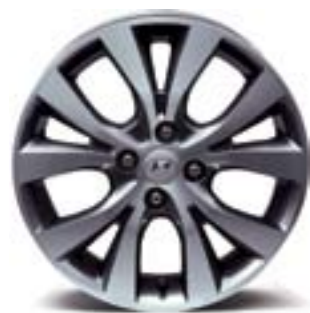
Mâm đúc hợp kim 16"